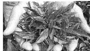
▲鹿児島の大豊かなく養育分と太陽の恵みで力強くつ無農薬・有機栽培の茶葉。

メーカーによると、「茶のしずく」に使用している茶葉は、日本一のカテキン含有量を誇る鹿児島産の無農薬・有機栽培茶葉。しかも飲み物として好まれる「二番茶」ではなく、良質のカテキンを豊富に含んだ「二番茶」のみをこだわって厳選使用。