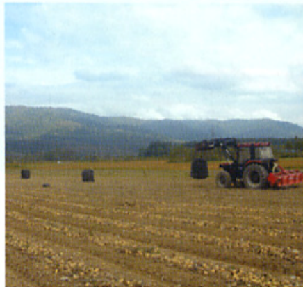
北海道 畑は、なんと甲子 園球場の50個分が入るほどの広さ！