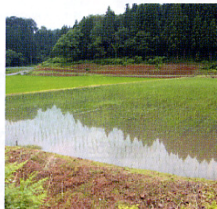
健康や環境のことを考えて、草や虫、自然とふれあいながら楽しんでいます。